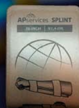
AP SERVICES SPLINT