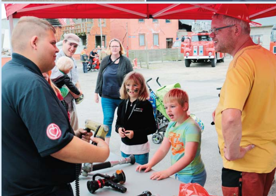
Der var mange stationer og momenter at opleve for deltagerne.