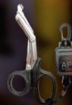
SIKRING TIL SAKS