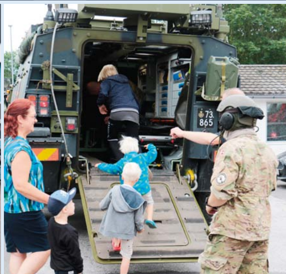
Normalt får børnene en tur i en ATV, men det blev gevaldigt trumfet, da 2. Sanitetskompani fra Aalborg i år lavede ture i deres pansrede militærambulance.